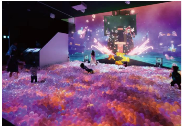
鮮やかな光と音が彩る、ハラハラドキドキの冒険型ボールプール「ZABOOM JOURNEY」