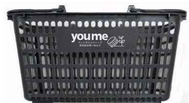
※画像は全てイメージです。