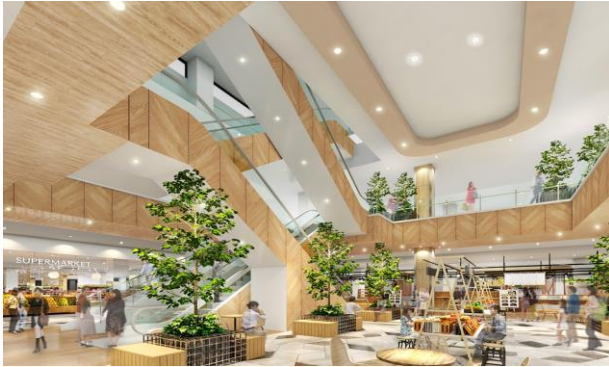
1F 吹き抜け：「NATURE（ネイチャー）」