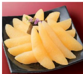
【利尻昆布仕込み味付数の子】