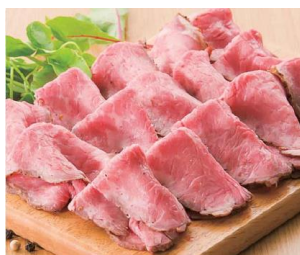
【王様のローストビーフ】