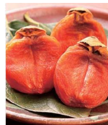
【島根県産 柿壺の干し柿】